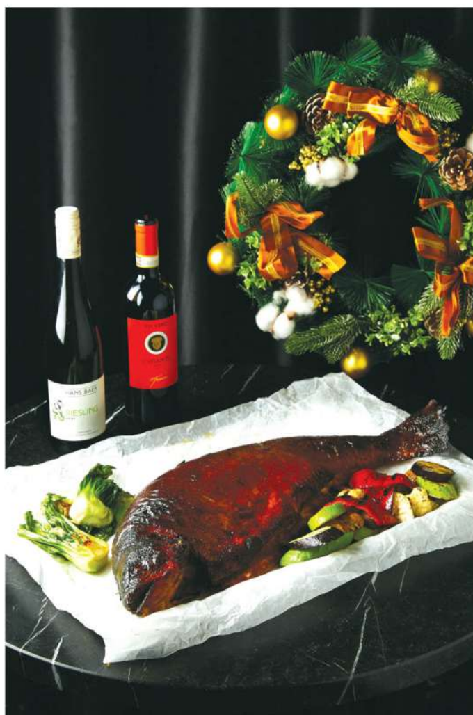
Семга запеченная целиком 70 000 ₺