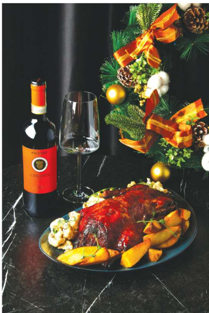
Утка запеченная с яблоками 30 000 ₺

Лосось слабой соли, эсколар, горбуша холодного копчения