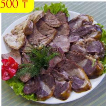
Ассорти из конины